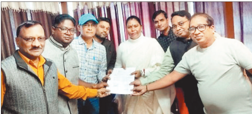
विधायकों को सम्मानित करते भाजपा कार्यकर्ता।

जशपुरनगर। पांच साल के कांग्रेस के कुशासन के विरुद्ध संघर्ष के बाद जिले की तीनों विधानसभा सीटों में जो भाजपा को जीत मिली है, यह पांचों के कार्यकर्ताओं की मेहनत और जिलेवासियों के विश्वास की जीत है। प्रदेश में सरकार बनने के बाद, कार्यकर्ताओं का ध्यान रखना हम सबकी जिम्मेदारी है। यह बातें जिले के वरिष्ठ भाजपा नेता कृष्ण कुमार राय ने कही। वे, जिला भाजपा कार्यालय में आयोजित बैठक में शामिल पार्टी के पदाधिकारी, जनप्रतिनिधि और कार्यकर्ताओं को संबोधित कर रहे थे। बैठक का आयोजन सोमवार को आयोजित होने वाले पूर्व प्रधानमंत्री अटल बिहारी वाजपेयी की जयंती पर सुशासन दिवस और 28 दिसंबर को प्रस्तावित मुख्यमंत्री विष्णुदेव साय के प्रथम जिला प्रवास पर आयोजित होने वाले कार्यक्रम की रूपरेखा पर विचार विमर्श करने के लिए आहूत की गई थी। कार्यक्रम को संबोधित करते हुए, भाजपा के जिलाध्यक्ष सुनील गुप्ता ने बताया कि सोमवार को सुशासन दिवस के अवसर पर जिले के सभी अटल चौक पर कार्यक्रम का